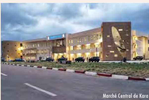
Marché Central de Kara