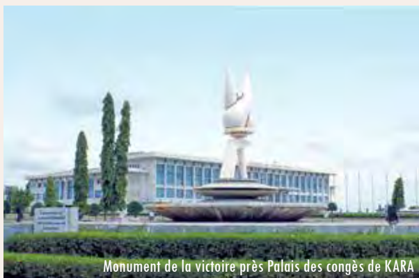
Monument de la victoire près Palais des congès de KARA