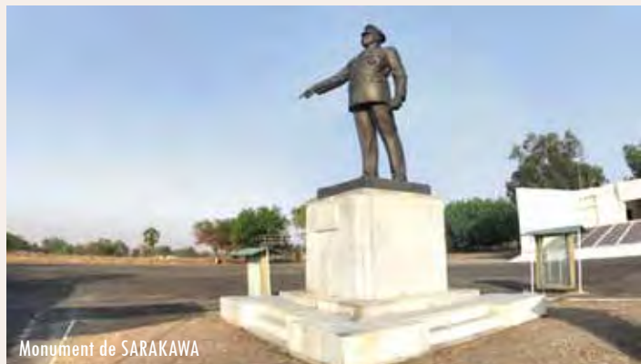
Monument de SARAKAWA