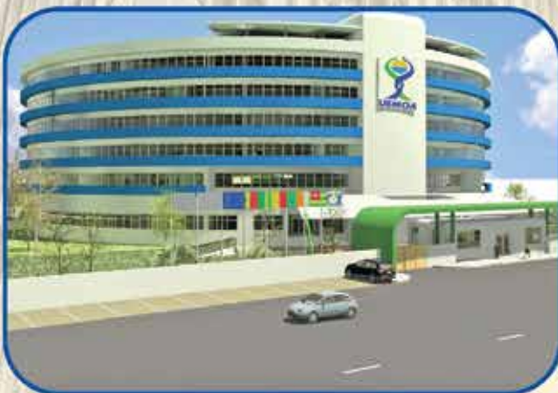
Chambre Consulaire et de Représentation de l'UEMOA à Lomé (Togo)