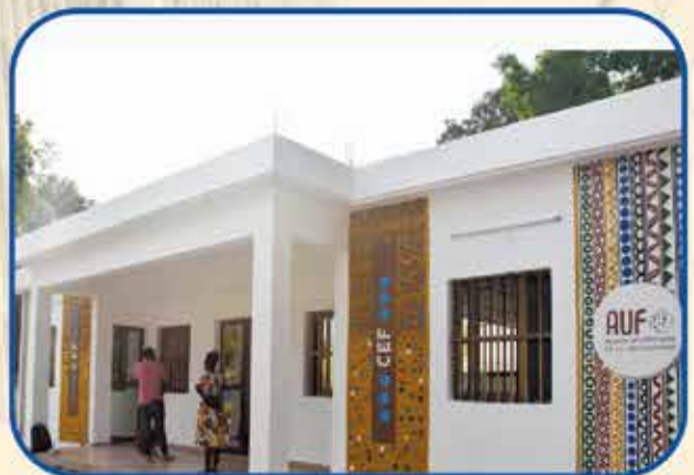
Centre d'employabilité de la Francophonie (CEF) Université de Lomé (Togo)