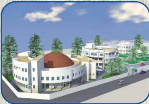
Siège du CAMES à Ouagadougou (Burkina Faso)

Les images ci-après illustrent parfaitement la maitrise d'œuvre complète réalisée dans les pays membres par l'EAMAU EXPERTISE.