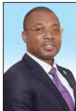
SUMSA Komla Amewokpo Représentant de l'ASECNA auprès de la République Togolaise