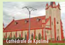
Cathédrale de Kpalimé

Le Togo, pays naturellement touristique, regorge une diversité de paysages, de sites et de monuments reconnus à l'international. Ceux-ci suscitent, à n'en point douter, un grand intérêt chez les amoureux du tourisme.